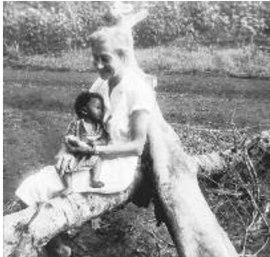
Rustend voor een arachide plantage.

de kindoki te vinden. Zo werd er een jongen van 12 jaar naar het hospitaal gebracht. Hij was na de zondagsmis nog te voet naar het dorp gegaan. Op maandagmorgen kon hij bijna niet meer ademen, hij leek te lijden aan pneumonie of bronchitis, doch hij had geen koorts, haalde zelfs geen 36°. We zagen dat hij stervende was. Wat was er gebeurd? De ouders werden ondervraagd: "Heb je de jongen iets gegeven?" – Natuurlijk zegden ze nee, 5 minuten later was de jongen overleden. De directeur van de lagere school zei me: "Sinds een paar jaar had de jongen een hartziekte. Als ik zag dat hij een aanval kreeg, zond ik hem naar het dorp en de ouders hebben steeds goed voor de jongen gezorgd". Natuurlijk waren ze telkens de 'feticheur' (inlandse genezer) gaan raadplegen en... de jongen moest dan 'sisal' (verdovend planten-aftreksel) drinken. Een paar jaar heeft hij het volgehouden. Waarschijnlijk hadden ze hem nu een te grote dosis gegeven. En dan werd er een kindoki aangewezen en waren er twee doden. In Beneden-Congo mag een vrouw slechts om de 2 jaren een kind hebben. Wordt deze regel overschreden, dan wordt ze verjaagd. Geregelde polygamie wilde de vrouw oorspronkelijk beschermen tegen zwangerschap, zodat ze haar baby 2 jaar kan voeden. Als de familie geen kind meer wil, moet de baby sterven.