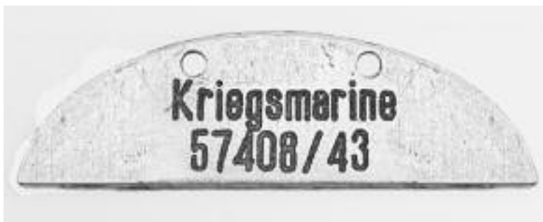
Bovenste helft van het militair identiteitsplaatje van de neergeschoten soldaat.

Aangezien ik sedert vele jaren in het bezit ben van de helft van het militaire identiteitsplaatje van een doodgeschoten Duitse soldaat, trok één specifieke gebeurtenis onmiddellijk mijn aandacht, namelijk deze van 4 september 1944 wanneer een op de vlucht zijnde Duitse soldaat door de Witte Brigade werd doodgeschoten.