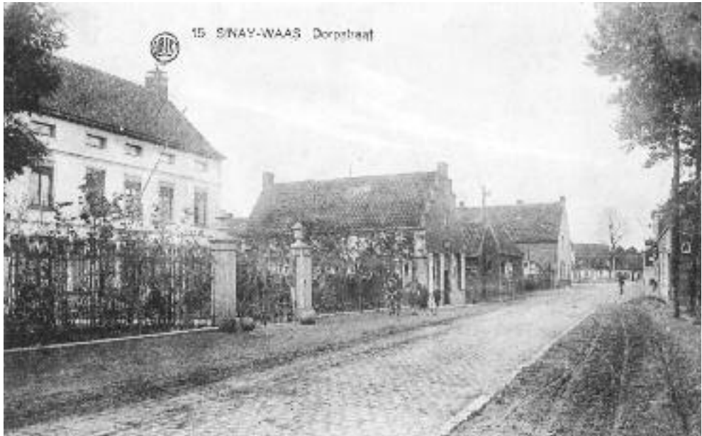
Het witte gebouw was de woning van Clement Besseleers, momenteel de Carrefour market.